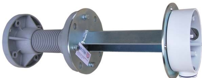
ISP130 + HIK170N + DS-1260ZJ

montážne otvory Ø5mm umožňujú inštaláciu týchto päťíc Hikvision : DS-1260ZJ, J-BOX01HK, DS-1280ZJ-S a DS-1280ZJ-DM18