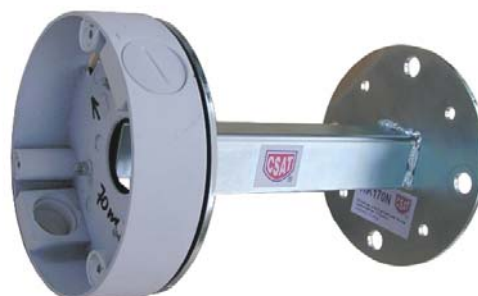
HIK170N + J-BOX01HK

montážne otvory Ø5mm umožňujú inštaláciu týchto päťíc Hikvision : DS-1260ZJ, J-BOX01HK, DS-1280ZJ-S a DS-1280ZJ-DM18